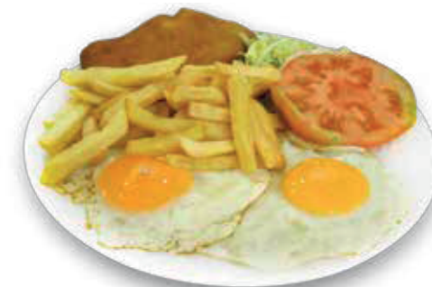
PLATO COMBINADO N.º 1

Paseo de España, 35 · Jaén Teléfono 953 369 636